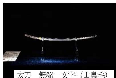
太刀 無銘一文字(山鳥毛)