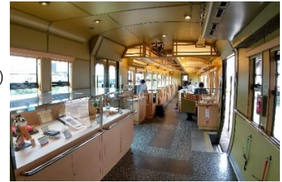
〇〇のはなし 車内(イメージ)