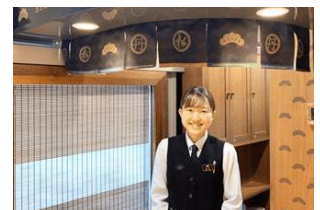
▲アテンダント(イメージ)