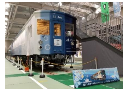
記念撮影コーナー(イメージ)