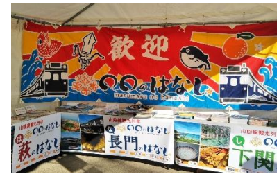
PR イベント(イメージ)