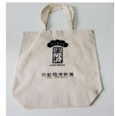
▲トートバック(イメージ)