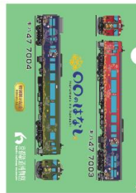
「〇〇のはなし」特製クリアファイル (画像はイメージです)