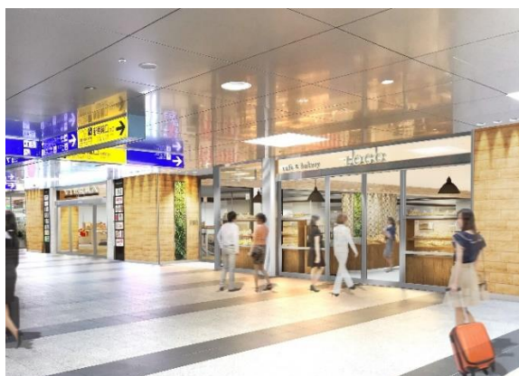
新幹線改札前3階入り口（イメージ）