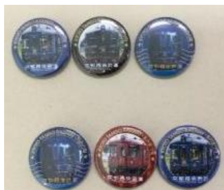
京都丹後鉄道 オリジナル缶バッジ (非売品) (いずれか 3 個、デザイン選択不可)