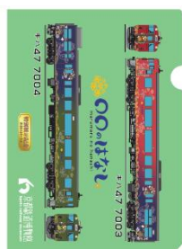
「〇〇のはなし」特製クリアファイル (画像はイメージです)