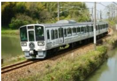
La Malle de Bois 外観

新たな魅力が増えた「La Malle de Bois」で行くせとうちの旅をぜひお楽しみください。