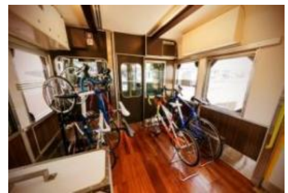
サイクルスペース (車内)