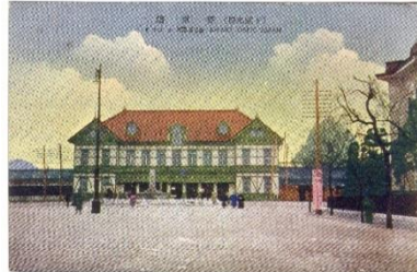
▲下関停車場と山陽ホテル(絵葉書)