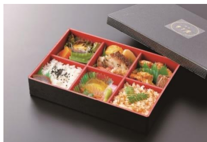
▲「〇〇のはなし」内で提供される 「夢のはなし弁当」