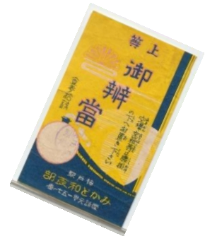
▲駅弁の掛け紙 ※画像はイメージ