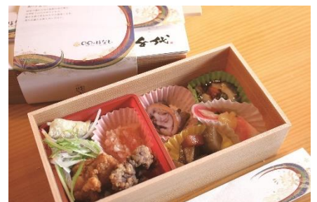
▲「〇〇のはなし」内で楽しめる 「萩のおつまみセット」