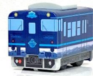
▲チョコロQ (あめつち)