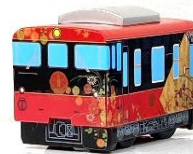
▲チョコロQ (花嫁のれん)