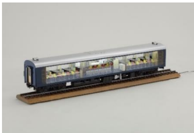
▲オシ 16 形客車模型 (縮尺 1/20)