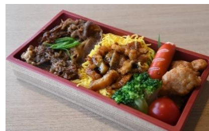
▲あなごとうしのいろいろ1BOXプレート