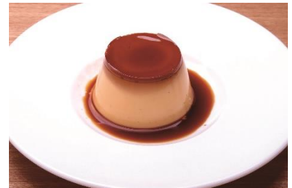
京乃百年洋菓子 百年プリン