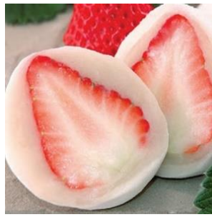
フルーツ大福（いちご）