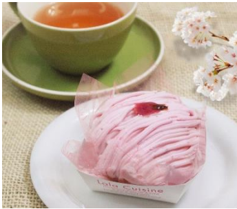
さくらモンブラン