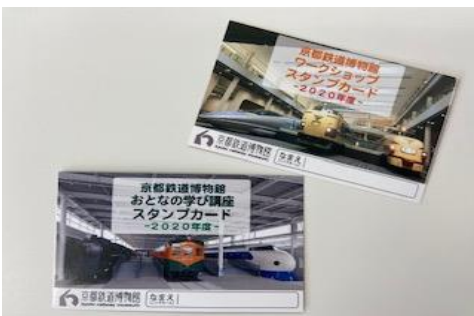
▲2種類のスタンプカード(イメージ)