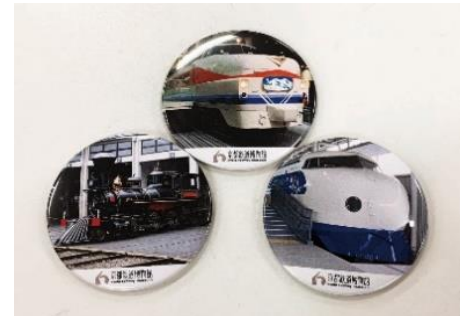
▲缶バッジ・缶マグネット(イメージ)