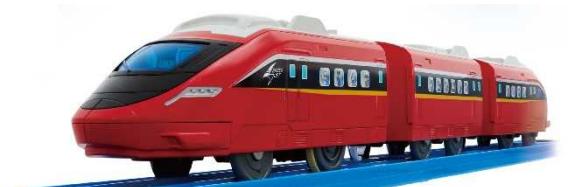
▲「スピードジェット」