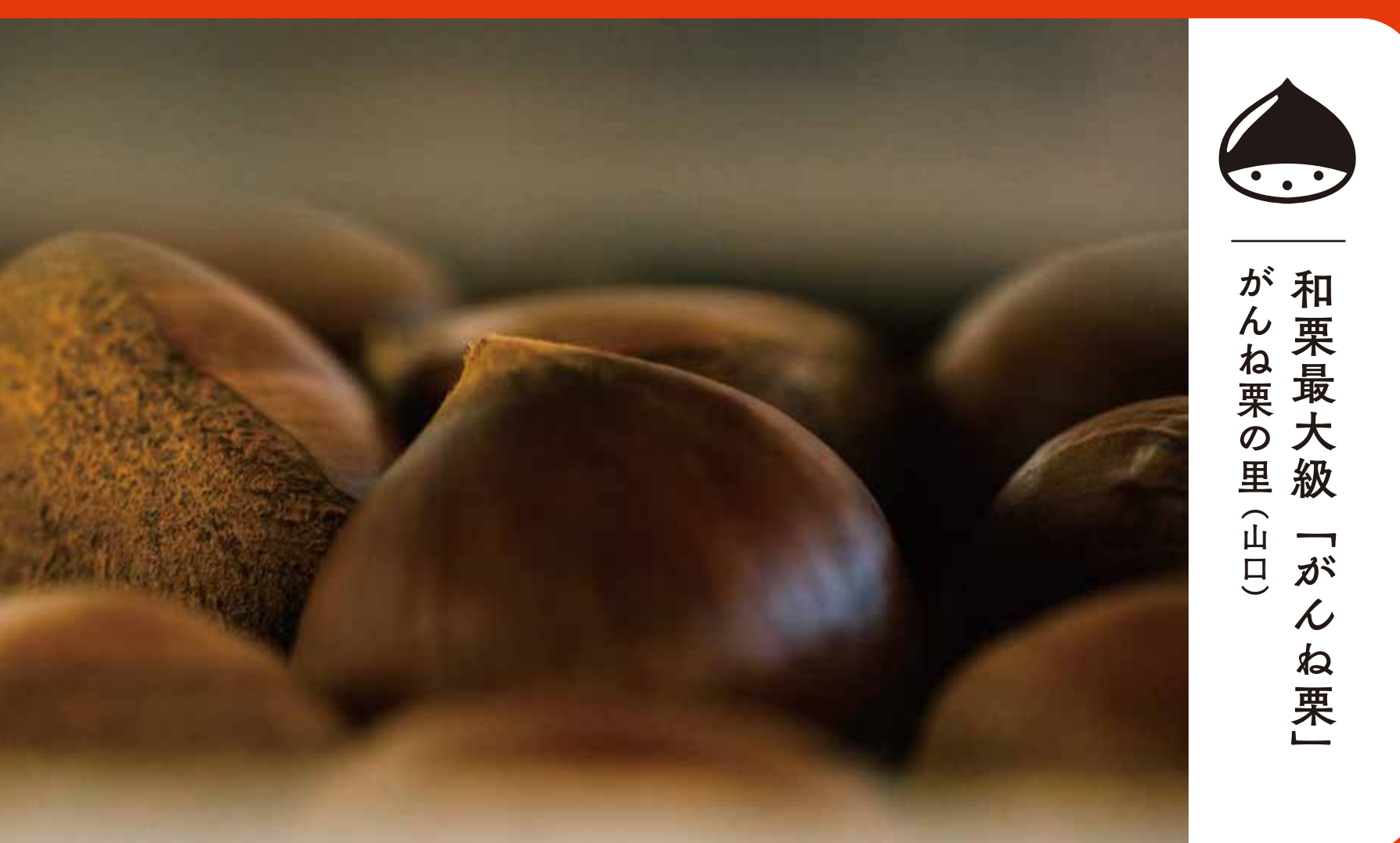
和栗最大級「がんね栗」 がんね栗の里 (山口)