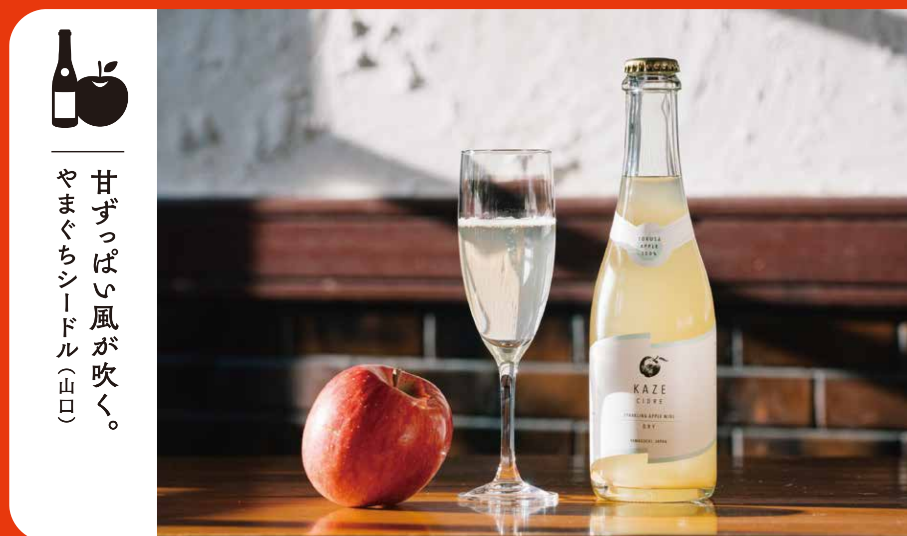
甘ずっぱい風が吹く。 やまぐちシードル (山口)