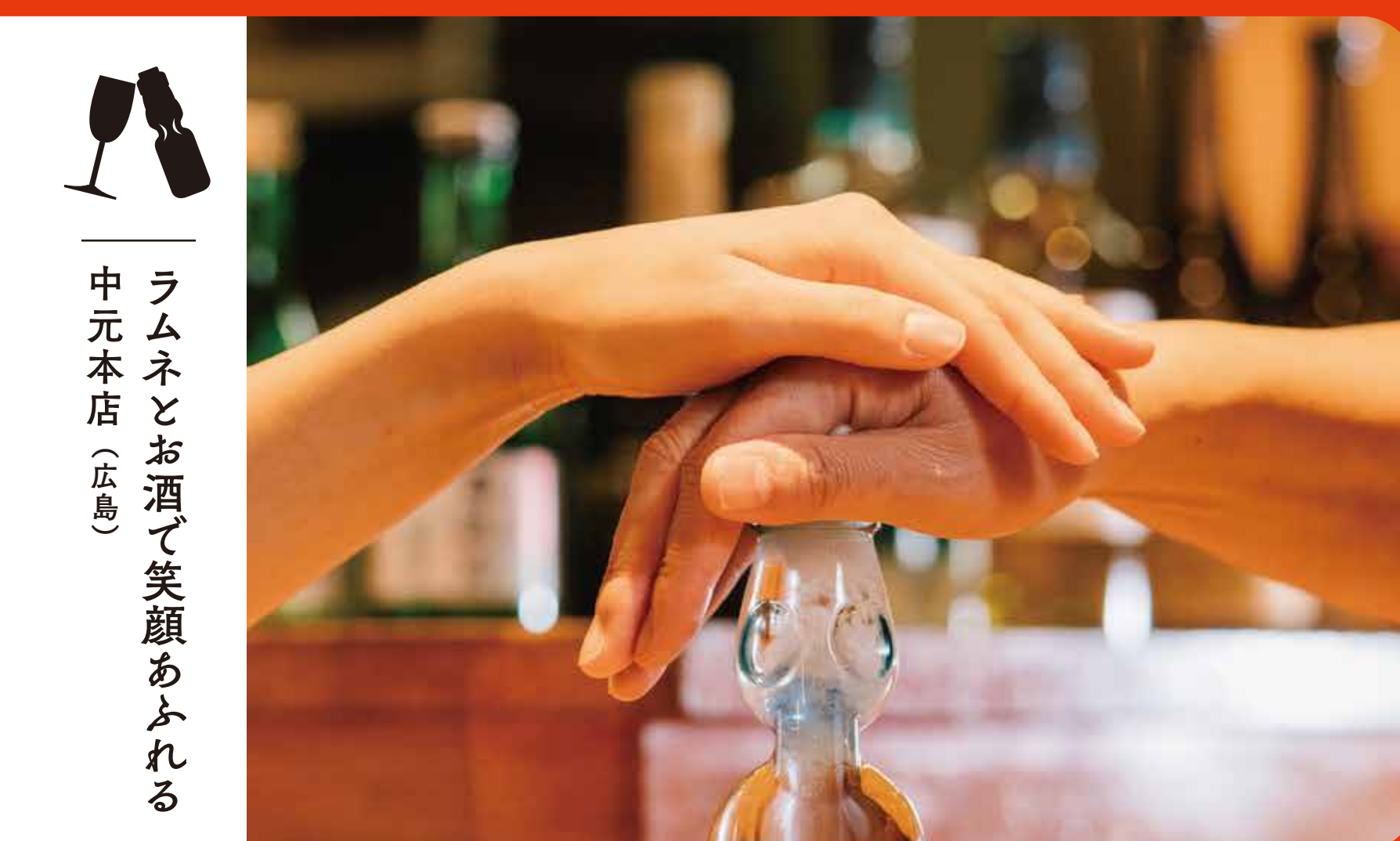
ラムネとお酒で笑顔あふれる 中元本店 (広島)