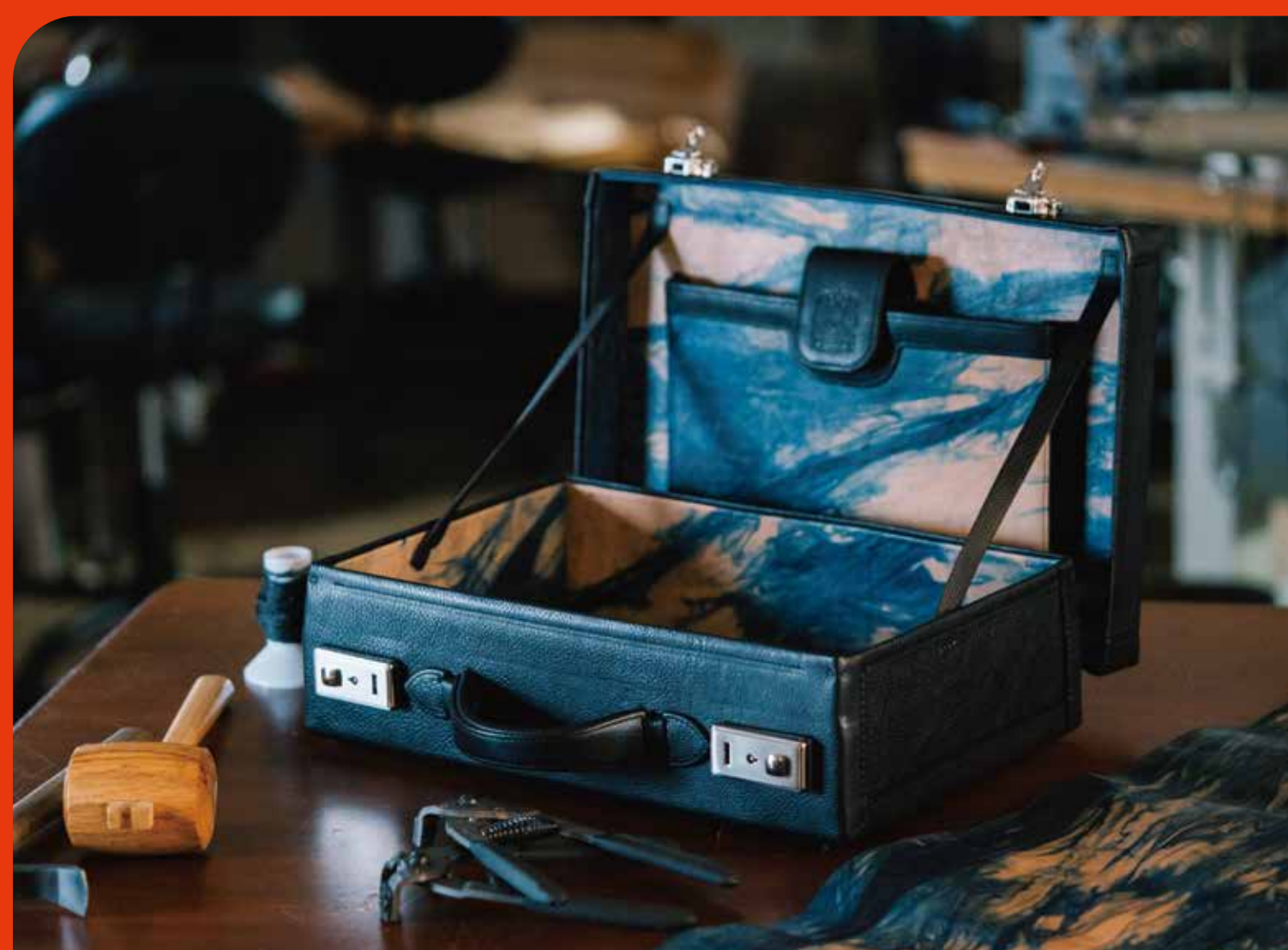
「内なる美」を本革で包む サイド (広島)