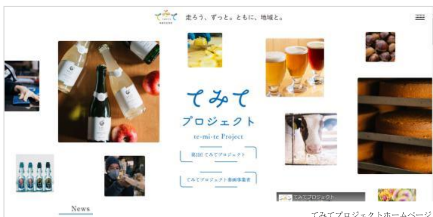
てみてプロジェクトホームページ

てみてプロジェクトは、今回のイベント開催を皮切りに、今後も新たな挑戦を続け、地域とともに走り続けます！地域と一緒にすすめる今後の展開にもご期待ください。