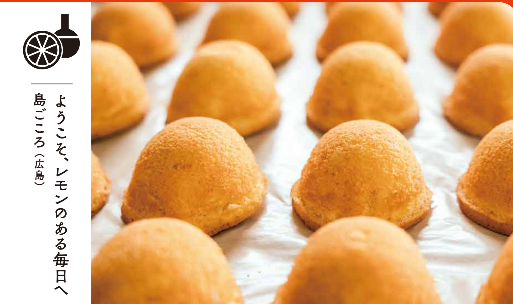
ようこそ、レモンのある毎日へ 島 (広島)