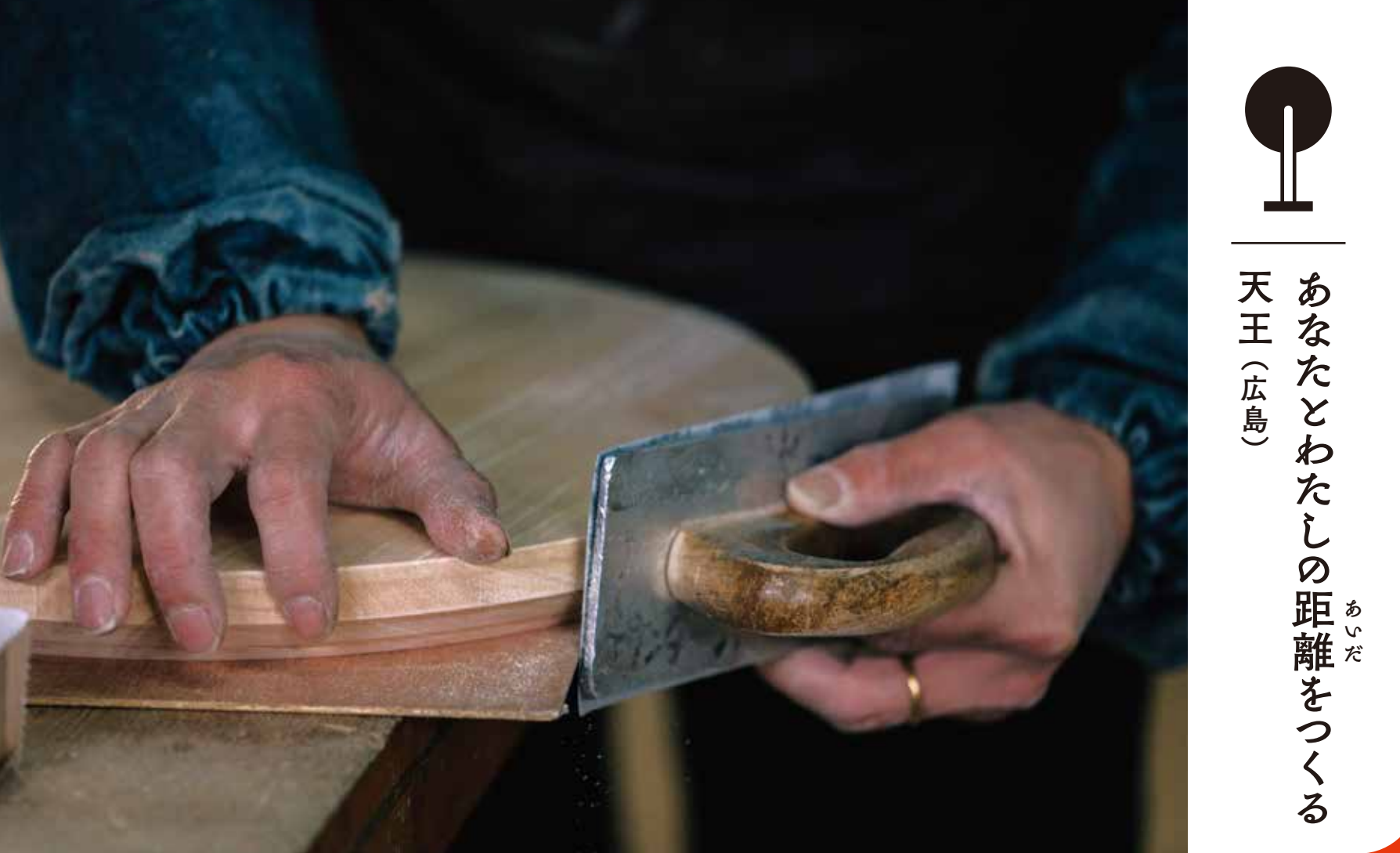
あなたとわたしの距離をつくる 天王 (広島)