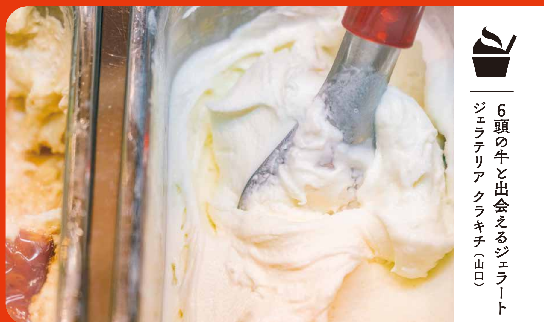
6頭の牛と出会えるジェラート ジェラテリアアクラキチ (山口)