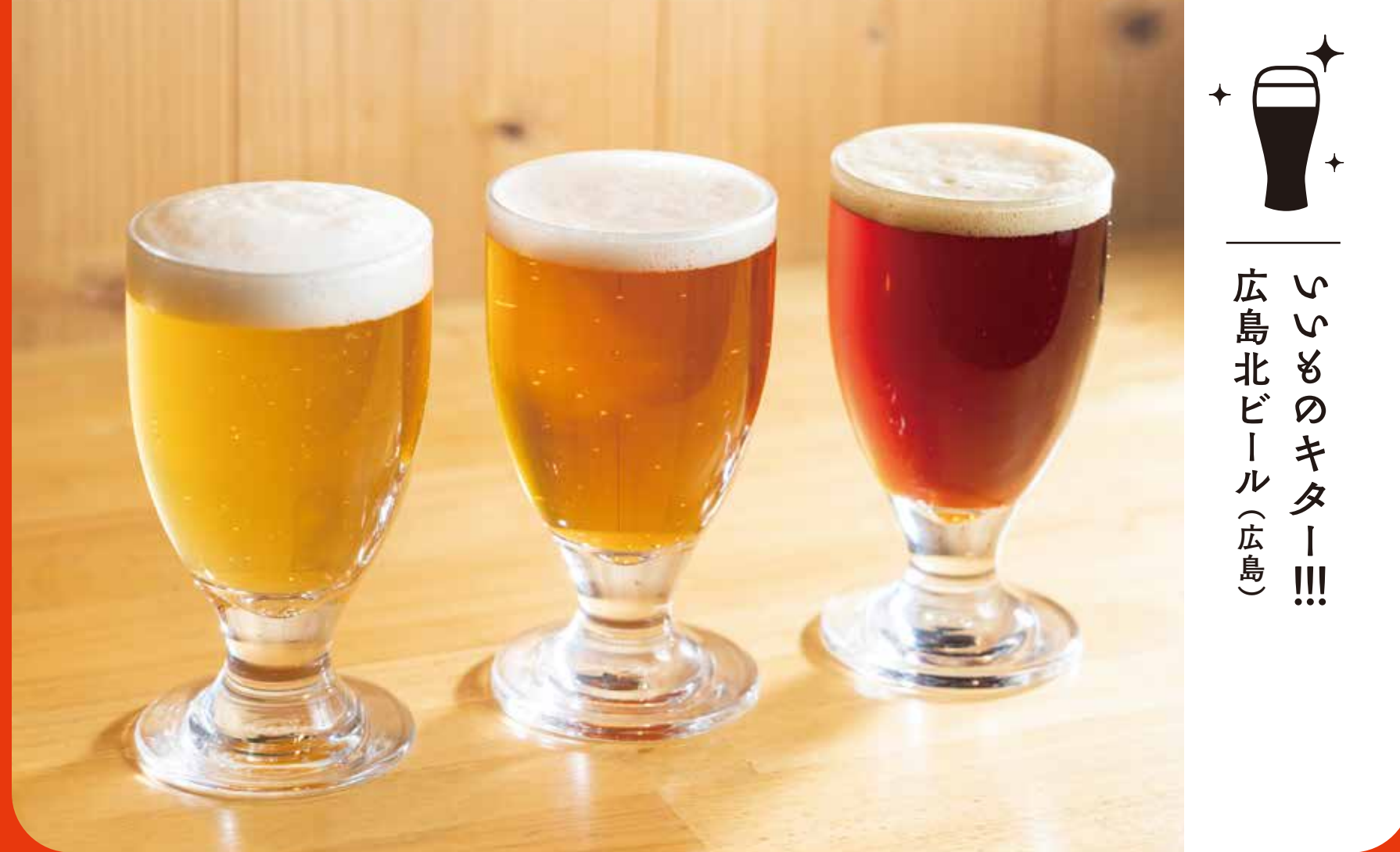
いつものキター!!! 広島北ビール (広島)