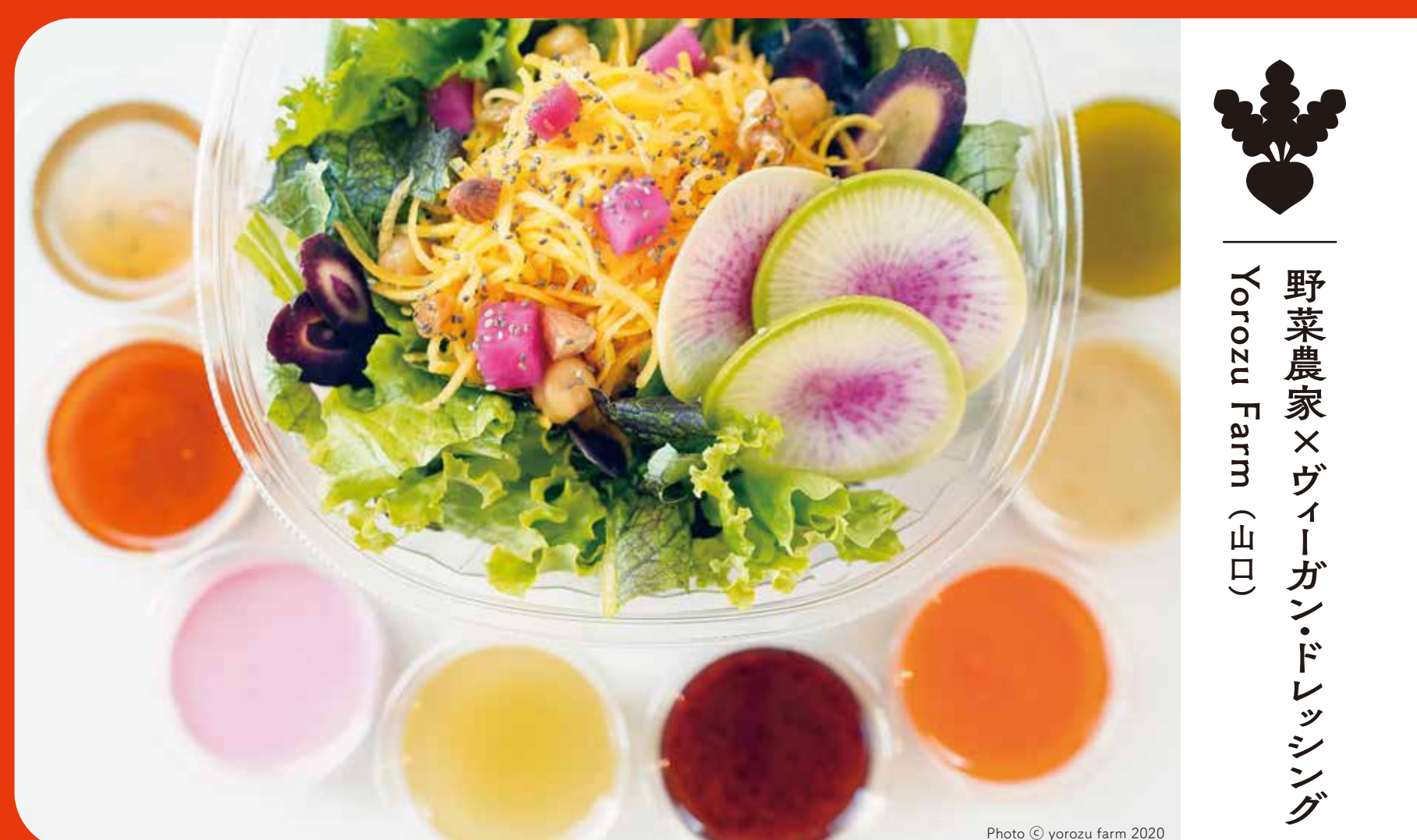
野菜農家×ヴィーガン・ドレッシング Yorozu Farm (山口)