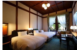
本館客室 「デラックス ガーデンビュー」