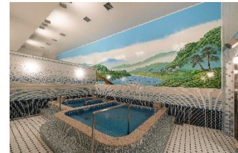
梅小路銭湯「ぼて湯」