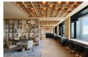
1日5回のフードプレゼンテーションが楽しめる「SPECIALTY SALON」