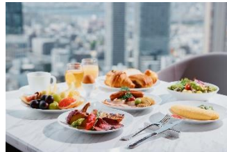
地元大阪や日本・世界各地から厳選した良質な素材が揃う朝食