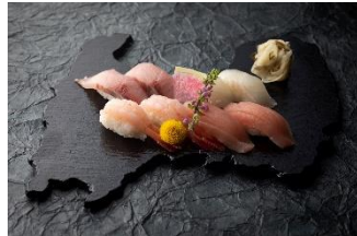
寿司職人が握る「握り寿司」が朝食から食べ放題