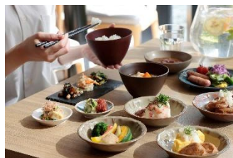
ごはんがすすむ「朝食ブッフェ」