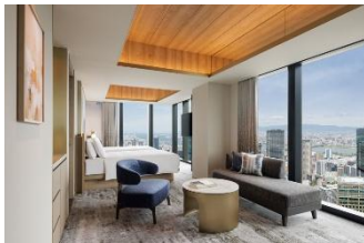
全客室30階以上の高層階から、眼下に広がる大阪の街並みを一望

また、唯一無二の「食」の魅力を追求するホテルとして、ここでしか味わえない食体験を3つのレストランや朝食で提供しています。