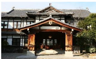
日本の美しさとドイツの様式が 融合した重厚な外観

※本キャンペーンの対象期間は1月4日(日)11:00チェックアウトまでとなります。