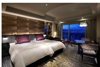
ホテルグランヴィア京都 デラックスツイン

ホテルグランヴィア京都や 2025 年 3 月に開業したホテルグランヴィア広島サウスゲートなど、駅直結の安心感を基盤として、「上質な旅の基点」コンセプトにゆとりを満ちた旅をサポートするフルサービス型ホテル。高層階客室専用の「グランヴィアラウンジ」や地元食材を使用した朝食メニューなど、その土地ならではの魅力を活かしたサービスが特徴です。