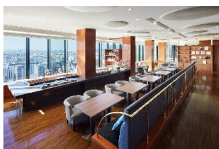
ホテルグランヴィア京都 グランヴィアラウンジ