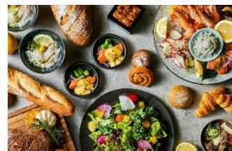
ホテルグランヴィア広島サウスゲート 朝食イメージ