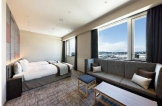
コンセプトフロア「ヴィスキオツイン」

その1つであるホテルヴィスキオ富山では、寿司屋の職人が握る富山名物「握り寿司」の食べ放題が朝食からお楽しみいただけるほか、大浴場や宿泊者専用ラウンジ、コインランドリーなどを取り揃え、自由自在の寛ぎを提供します。