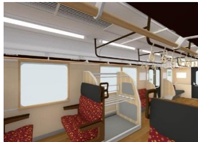
大型荷物置き場の設置