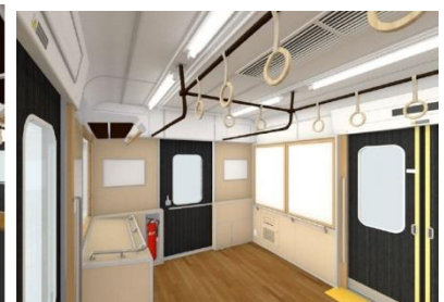
フリースペースの設置