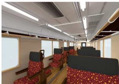
快適な大型クロスシート