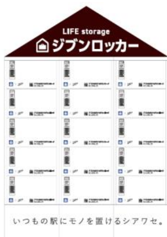
【デザインパターン①おうち】

お家のように、秘密基地のように…自分の居場所としてお使いいただきたいという想いを込めて込めた三角屋根のデザイン。①大阪駅 3 階③新大阪駅 1 階に設置。