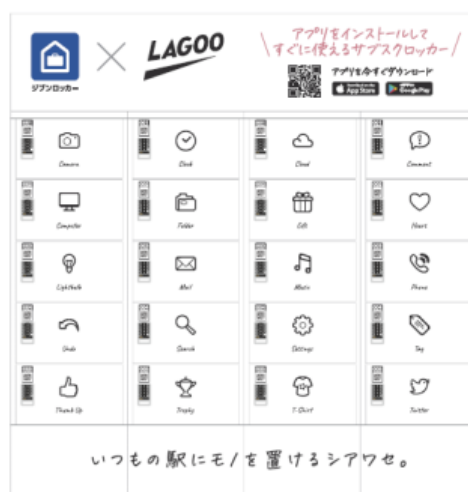
【デザインパターン②：ワクワク】

お家のように、秘密基地のように…自分の居場所としてお使いいただきたいという想いを込めて込めた三角屋根のデザイン。①大阪駅 3 階③新大阪駅 1 階に設置。