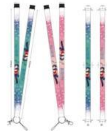
ネックストラップ(表裏) ¥1,200