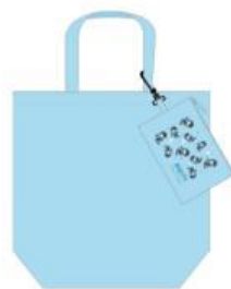
ポーチ付エコバッグ ¥1,200