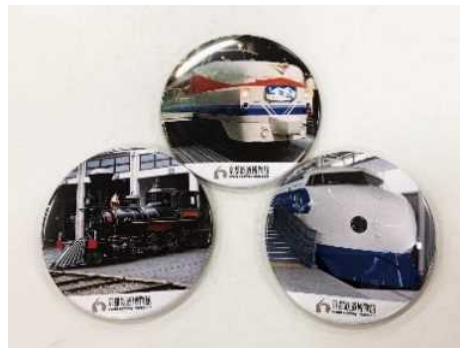
▲缶バッジ (イメージ)