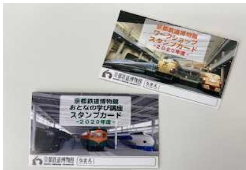
▲スタンプカード (イメージ)