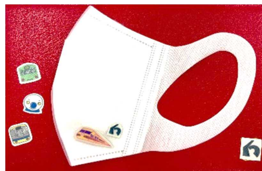
▲自分だけのオリジナルマスクシールが作れます！