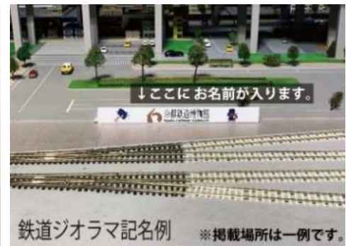
▲鉄道ジオラマ内看板記名 (イメージ)