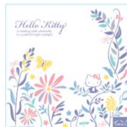
＜ハローキティ ガーゼ風タオル＞