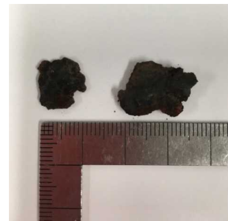
写真4 車の所有者様が所持していたさび片