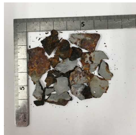
写真3 道路上に落ちていたさび片