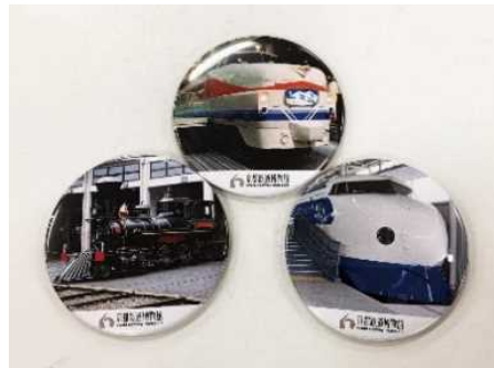
▲缶バッジ (イメージ)