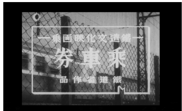
▲収蔵映像で昔の切符について解説！