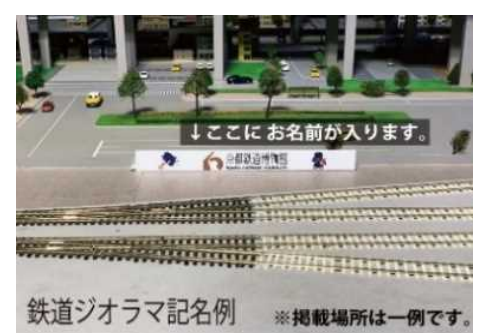
▲鉄道ジオラマ内看板記名 (イメージ)