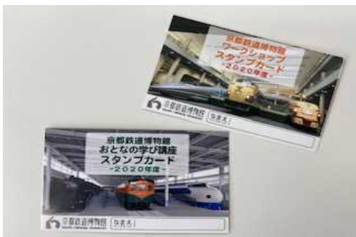
▲スタンプカード (イメージ)