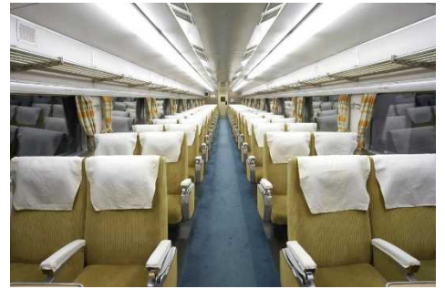
▲「0系新幹線電車16形1号車」車内