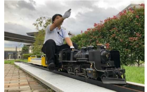
▲本物のSLと同じ仕組みで動くミニSLがけん引する客車に乗車できます。