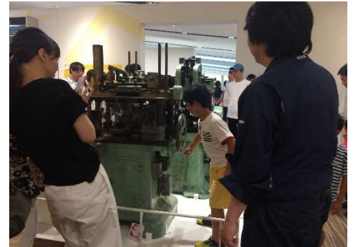
▲本物の硬券印刷機を動かしてみよう！