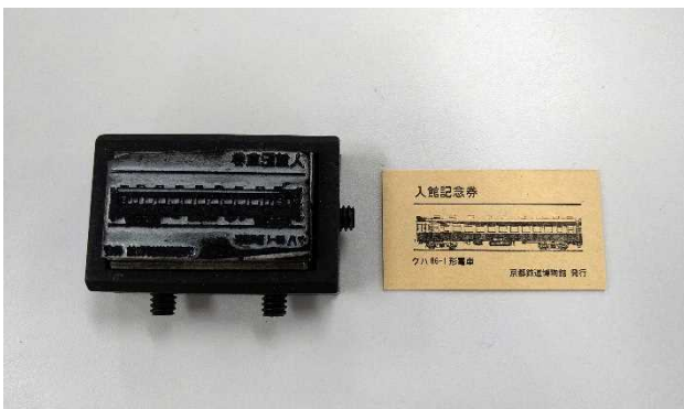
▲どんなデザインかな？ ヒント：今年、誕生70周年を迎える アノ車両♪