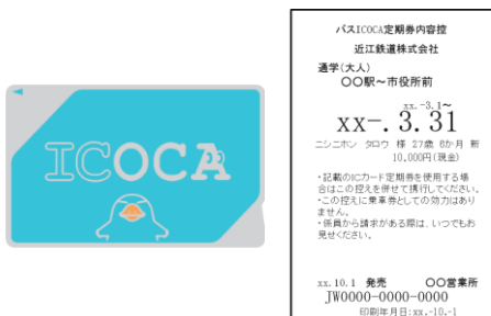
<バス ICOCA 定期券内容控>