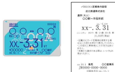
<バス ICOCA 定期券内容控>