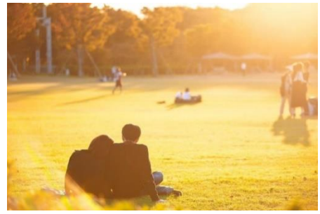
「第3回 京都・梅小路フォトコンテスト」受賞作品

「京都・梅小路みんながつながるプロジェクト」は、京都・梅小路エリア（京都駅～梅小路公園周辺のエリア）の魅力を発掘する「第4回 京都・梅小路フォトコンテスト」を、2020年10月1日（木）から2021年1月31日（日）の期間に開催しますのでお知らせします。