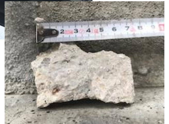
落下物 (コンクリート片)