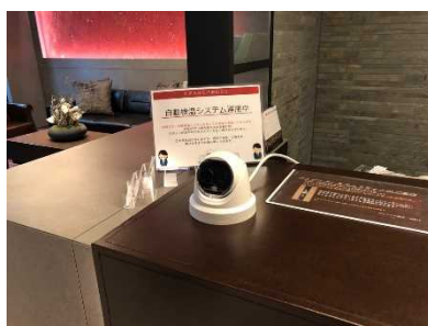
設置場所（フロント）