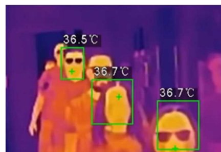
サーマルカメラ画像