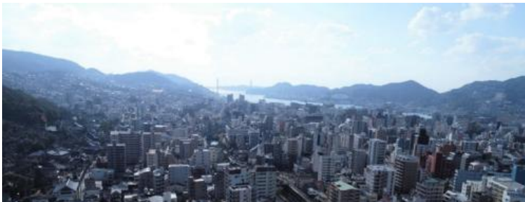
高層階からは長崎湾を一望

※2 「クワッドロックシステム」はエントランスから玄関までの四重のセキュリティのことを指します。