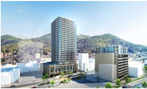
ライオンズタワー新大工町 外観イメージ