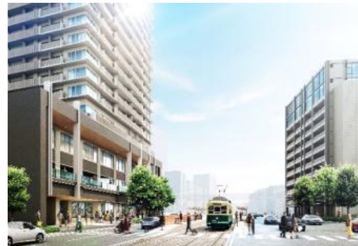
(左) 北街区 (右) 南街区

本事業は、新大工町商店街を含む中心市街地の活性化実現を目的に推進している再開発事業であり、そのうち分譲マンションの開発をJV5社で推進しています。国道34号と長崎電気軌道「新大工町」電停徒歩1分に位置し、利便性の高いエリアです。北街区には商業施設と住宅、国道34号を挟んだ南街区には駐車場と業務施設を設け、二つの街区は新設される歩道橋でつながる予定です。本マンションは、北街区に建設される地下1階・地上26階建て複合ビルの4階から26階に位置し、長崎県内最高峰 ※1 タワーマンションとなります。