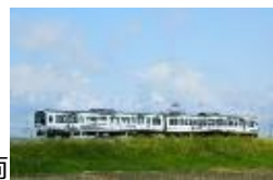
La Malle de Bois車両