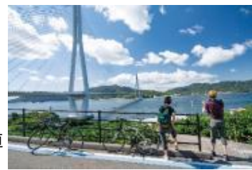
しまなみ海道 サイクリング