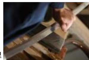
備前おさふね刀剣の里