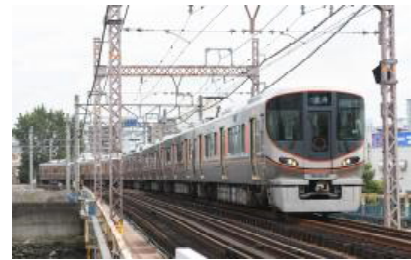
JR ゆめ咲線 時刻表（平日）

JR ゆめ咲線では、新製車両を追加投入し通勤やユニバーサル・スタジオ・ジャパン™へのおでかけで混雑する平日7:30～8:30に西九条～桜島間の列車を2往復増発します。これにより、上記時間帯では概ね6分間隔で運転し、通勤・おでかけがより便利になります。