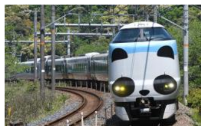
「パンダくろしお」の運転時刻（主要駅）

くろしお 3, 6, 25, 26 号を、これまでご好評頂いている「パンダくろしお『Smile アドベンチャートレイン』」で毎日運転します。これにより、「パンダくろしお」をよりご利用しやすくなります。