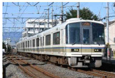
みやこ路快速 時刻表（土休日）

土休日に6両で運転するみやこ路快速が12本から35本に増え、全列車6両で運転します。これにより、京都～奈良間のご利用がより快適になります。