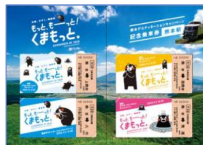
中面デザインイメージ