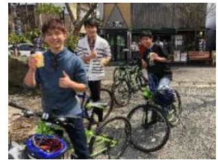
たベコギのイメージ