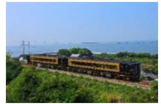
特急「A列車で行こう」