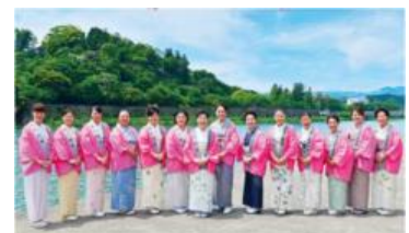
人吉温泉さくら会