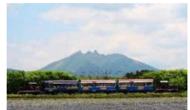
南阿蘇鉄道「ゆうすげ号」

○設定期間：土曜、日曜、祝日及び2019年7月20日（土）から9月1日（日）の毎日