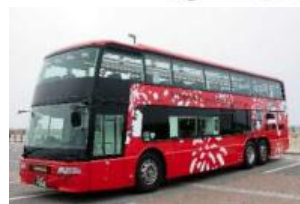
レストランバス外観