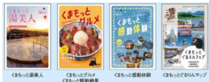
ガイドブック表紙