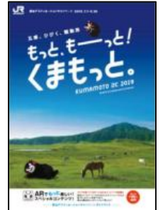
ガイドブック表紙

各エリアの観光情報やキャンペーン期間中に開催されるＤＣ特別企画、イベント情報などを掲載した熊本ＤＣガイドブック約４０万部を、全国のＪＲ主な駅や旅行会社窓口を中心に配布します。