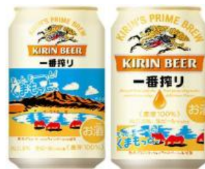
デザインイメージ