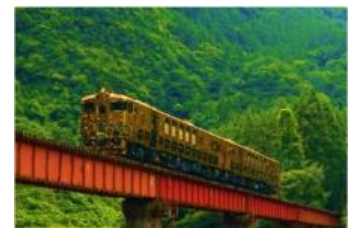
「或る列車」運行イメージ

熊本DC期間中、豪華スイーツコースで大人気の「JRKYUSHU SWEET TRAIN『或る列車』」が、豊肥本線大分駅～阿蘇駅間を特別運行します。