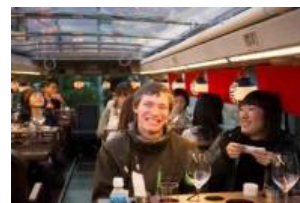
レストランバス車内イメージ