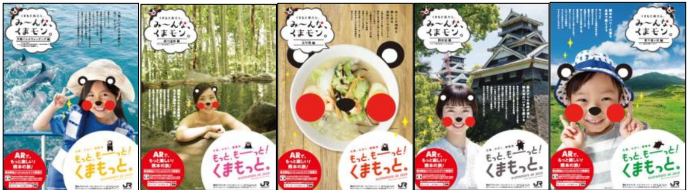
(A) 天草イルカウォッチング

熊本県が制作した5連貼りポスターを、2019年6月1日（土）～30日（日）の間、全国のＪＲ主な駅に掲出します。ＤＣガイドブックでも紹介する、スペシャルコンテンツのＡＲカメラ“ＣＯＣＯＡ Ｒ２”の活用をイメージしたポスターです。