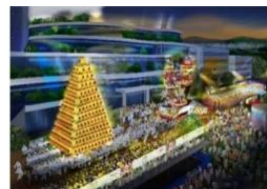
メイン会場イメージ