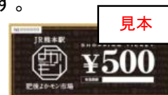
ショッピングチケット イメージ