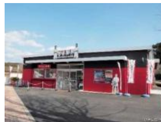
金栗四三ミュージアム