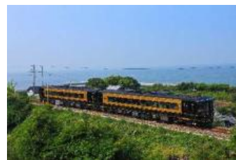
特急「A列車で行こう」