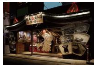
熊本火の国ワールド (協力店舗の一例)