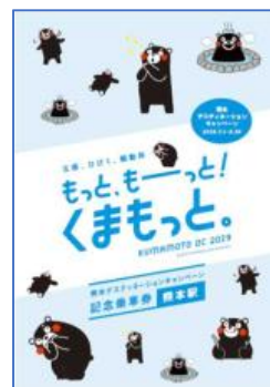
表紙デザインイメージ