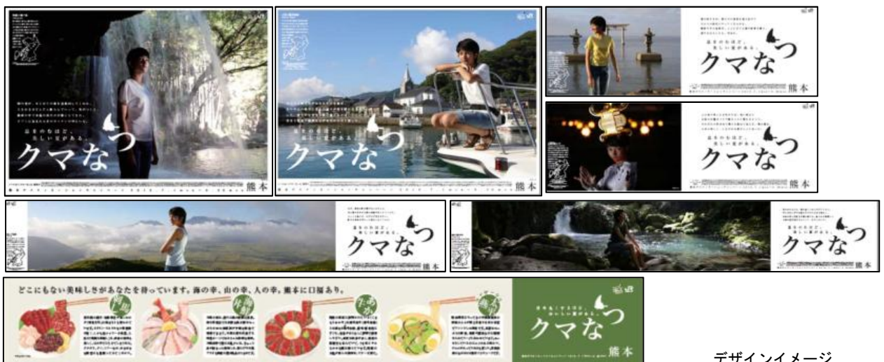
デザインイメージ

今回のポスターのタイトルは「クマなつ」です。熊本の夏を満喫するデザインとなりました。（掲出時期）2019年5月24日（金）～9月30日（月）まで全国のＪＲの主な駅・車内等に掲出。