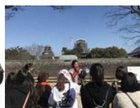
ガイドツアーのイメージ