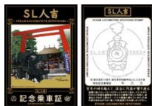
特別記念乗車証イメージ