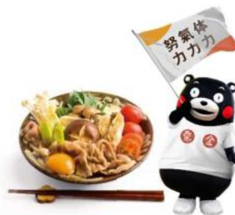
オリジナルメニューのイメージ