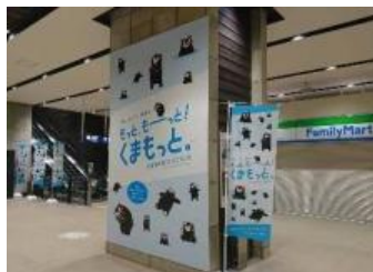
バナー・のぼり旗イメージ

熊本DCの開催期間中、熊本駅の駅コンコースなどでは、熊本DCのバナーやのぼり旗、フラッグなどを設置するほか、JR九州の主な駅ではミニのぼり旗を設置します。