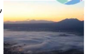
かぶと岩展望所からの景色