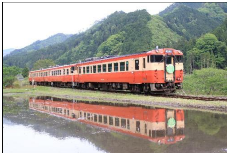
昨年春のみまさかスローライフ運転時の風景