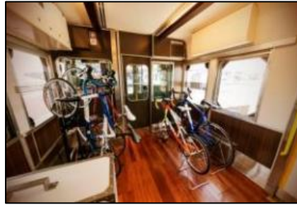
車内(サイクルスペース)