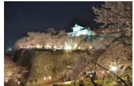
津山城(鶴山公園)の夜桜 (※イメージ)

「津山さくらまつり」にあわせて、津山鶴山公園で「夜桜」を楽しむことができる臨時列車を岡山～津山間で運転します。