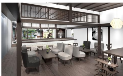
外部からも利用可能なカフェを併設