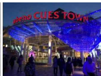
あべのキューズモール