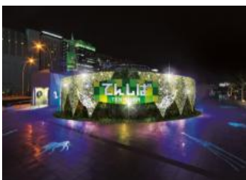
天王寺公園エントランスエリア てんしば