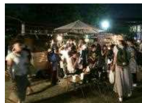
キッチンカーイメージ

開催時間：2017年8月5日(土)、6日(日) 14時00分～21時00分 開催場所：中央広場