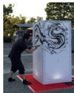
墨絵ライブイメージ

開催日：2017年8月6日(日) 開催時間：18時00分～18時20分(予定) 開催場所：中央広場