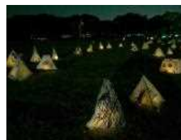
オリジナル行灯点灯イメージ