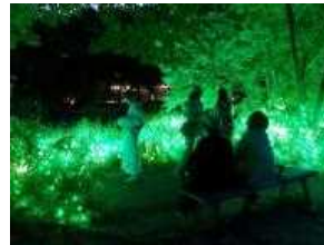
水辺のイルミネーションイメージ