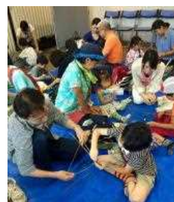
行灯をつくろう！イメージ