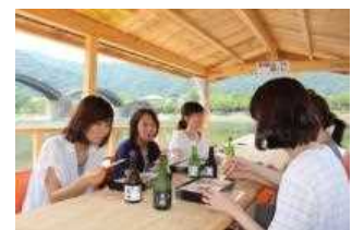
秋の錦帯橋「地酒舟」

錦川に浮かぶ遊覧船で、錦帯橋と紅葉に染まる秋景色を楽しみながら、岩国5歳の地酒の飲み比べや郷土料理のお弁当を味わえます。