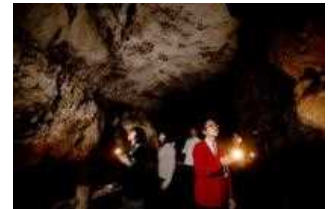
秋芳洞闇のロマン探検

DC期間中に県内各地で自転車ロードレースを開催。さらに、新山口駅でのレンタサイクル開始やサイクリトレインの運行など、サイクリスト向け特別なサービスを提供します。