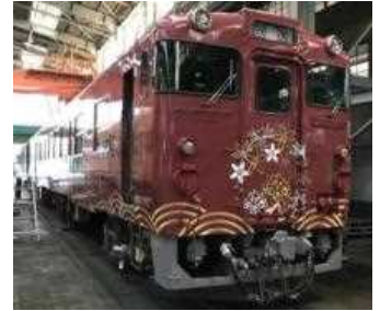
山陰線 観光列車「〇〇のはなし」

~ 道の駅 北浦街道 豊北 ~ 下関駅 (13:25 着) ~ 新下関駅 (13:55 着)