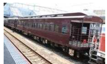
SL「やまぐち」号新製客車

山口DCに合わせて、SL全盛期の客車を復刻した新しいレトロ客車での 運行を平成 29 年 9 月 2 日 (土) より開始します。