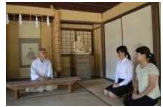
松陰神社宮司による松陰講話

普段上がることのできない松下村塾に上がり、松陰神社宮司による幕末秘話を特別に聴講することができます。