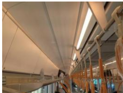
【女性専用車両（電球色LED）】