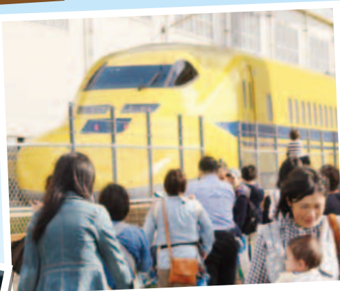
ドクターイエロー展示