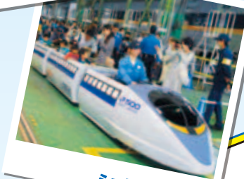
ミニ新幹線乗車会