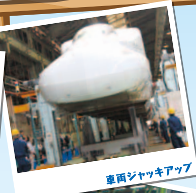
車両ジャッキアップ