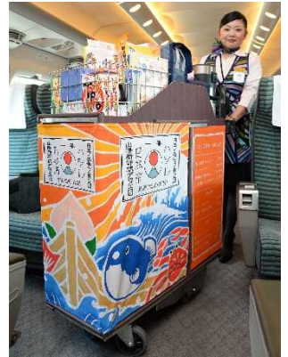
キャンペーン中、約1割のワゴンを山口県萩市の大漁旗メーカーで染めた実物の大漁旗で装飾。