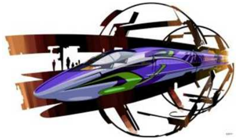
「500 TYPE EVA」外観イメージ

こだま741号とこだま730号を「エヴァンゲリオン」とコラボした「500 TYPE EVA」で運転する日をお知らせします。