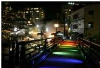
【湯村温泉宿泊券1組2名様】