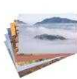
【朝来市特産品】 竹田城跡6枚セット 【10名様】