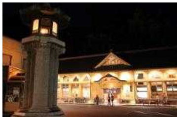
【城崎温泉宿泊券1組2名様】