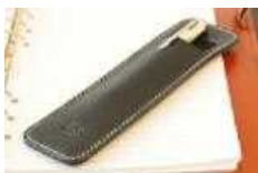
【豊岡市特産品】 かばん屋さん作った ペンケース 【10名様】