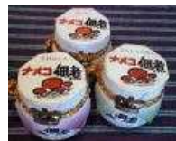
【新温泉町特産品】 季節の地元特産品を 使った加工品 【10名様】