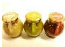
【養父市特産品】 朝倉さんしょジェノベ ーゼ等3品セット 【10名様】