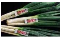
【朝来市特産品】 幻のねぎ「岩津ねぎ」 【2名様】