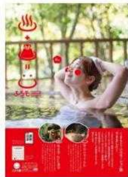
くまもと・ふるモーションイメージポスター