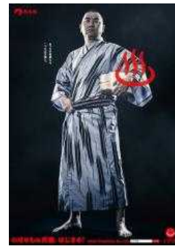
のぼせモンイメージポスター