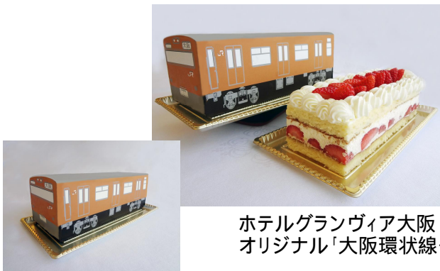
ホテルグランヴィア大阪 オリジナル「大阪環状線ケーキ」

上記の個人情報は選考・決定したカップルへの通知に使用させていただき、ご本人の同意なくそれ以外の目的で使用いたしません。