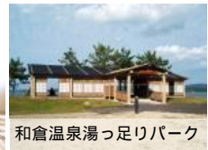
和倉温泉湯っ足りパーク