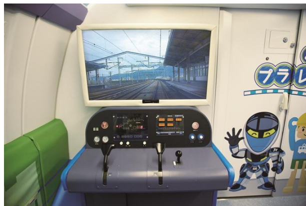
【お子様向け運転台】