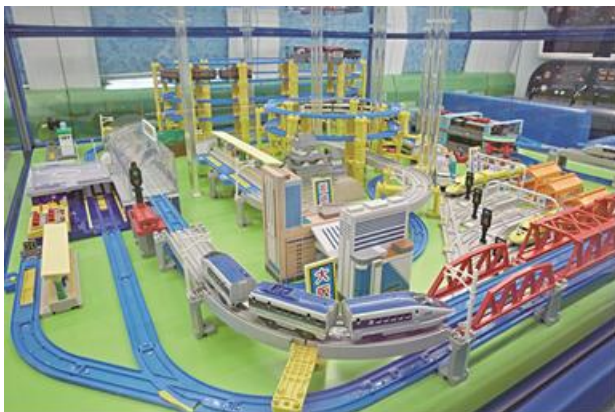
【プラレールの大型ジオラマ】