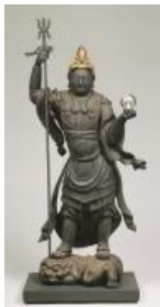
建仁寺 霊源院 「毘沙門天立像」