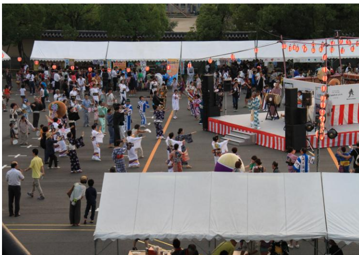
(昨年の盆踊りの様子)

例年8月1日の晩に開催されますが、今年にはサマーフェスタ当日の8月2日の晩にも拡大して開催されます。