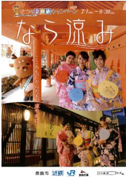
(パンフレット表紙)