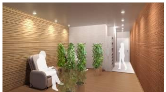
(リラクゼーションルーム)