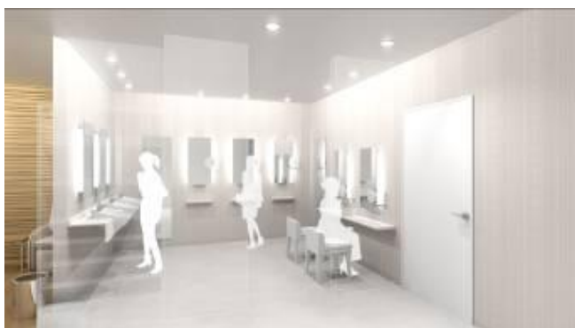
(従業員用パウダールーム)

6F後方エリアには、マッサージチェア付のリラクゼーションルームやパウダールームを設置