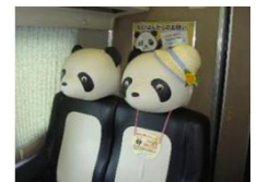
パノラマ編成の4号車には、パンダシートが設置されています。