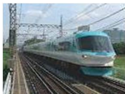
オーシャンアロー編成