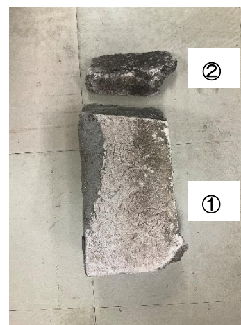
〔落下物（コンクリート片）〕