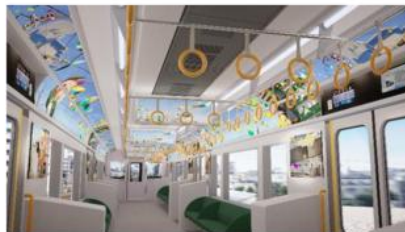
車内空間演出 (画像はイメージです)