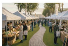
日常に開かれた交流機会のイメージ