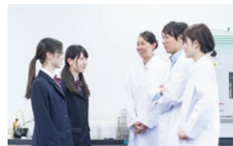
学びと交流機会のイメージ