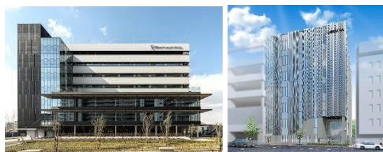
J. NODE Lab 健都