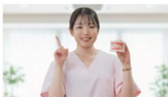
健康の体験・実践機会のイメージ