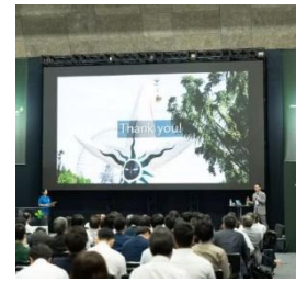
昨年度の会場の様子