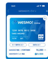
Wesmo!オンラインカード (画面イメージ)

※Wesmo!オンラインカード (JCB) を発行。オンラインのJCB加盟店でご利用可能。